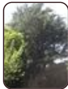
Himalayaceder St.- Agatha - Berchem Basilieklaan, 14