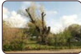
Gewone wilg St.- Agatha - Berchem Broekweg