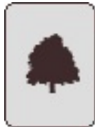
Acer pseudoplatanus 'Purpurascens' St.- Agatha - Berchem Zavelenberg