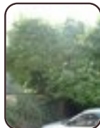
Magnolia sp St.- Agatha - Berchem Openveldstraat, 90-92