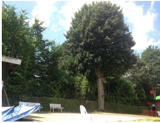
Acer pseudoplatanus 'Purpurascens',